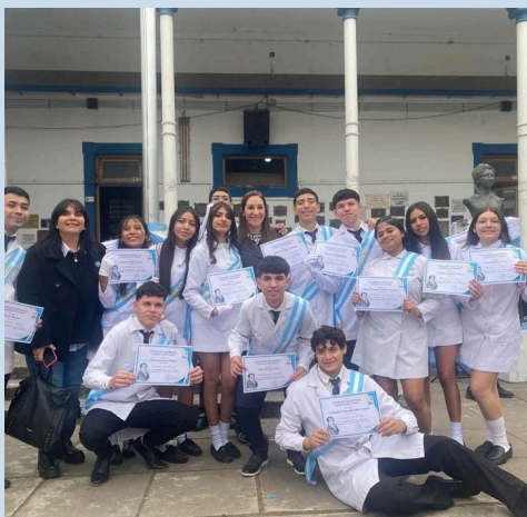
Acto del juramento a la Bandera Nacional 2024

Cuando finalmente volvimos a la presencialidad, me di cuenta de lo rápido que había pasado el tiempo. Me sentí un poco triste por haber perdido esos dos años de experiencias en la escuela, que son únicas e irrepetibles. Pero al mismo tiempo, también sentí que esos dos años online me habían enseñado mucho sobre adaptarme y ser más responsable con mis estudios. Ahora, al estar en sexto año, se siente extraño saber que somos promo. La secundaria pasó mucho más rápido de lo que pensaba, y eso me hace valorar aún más el tiempo que nos queda.