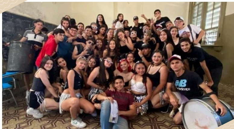
Foto tomada por alumnos de 6to año en la semana 2021, momentos antes e la despedida de la promoción.

La promoción 2021, sin duda alguna ellos tuvieron miedo. Miedo de perder su año siendo egresados. En 2020 fueron pre promo y se perdieron su presentación de la promo, el campamento tan icónico que se realizaba en ese tiempo para los alumnos de 5to año, sus fiestas, entre otras cosas. Sin contar que el perder dos años de clases les afectó bastante en la facultad ya que algunos no se sentían preparados/as