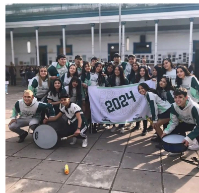
presentación de buzos de egresados

Sentí muy corto este tiempo en el colegio. Ahora solo quedan meses para terminar y Sentí que los 2 años que me quedaban pasaron muy rápido y ahora solo queda disfrutar el poco tiempo que nos queda al máximo, valorar día a día las risas, las salidas, los momentos juntos y hacer que cada día sea un recuerdo hermoso de nuestro colegio.