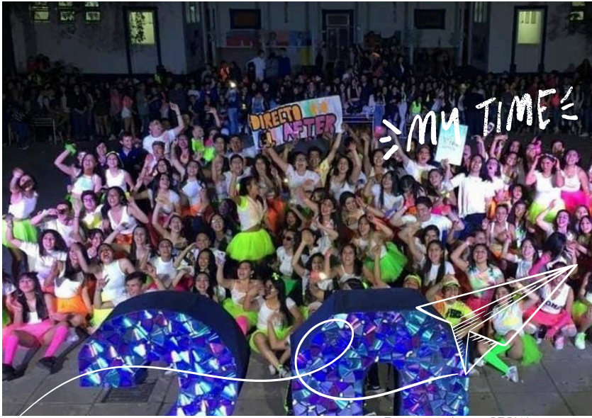
semana 2019 presentación de la promoción 2020.